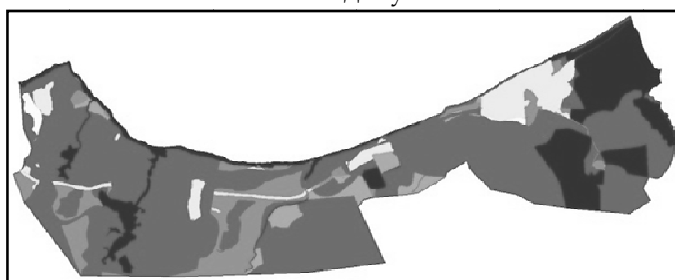
Рис. 4. Отдельные слои из проекта интегральной карты целей экологически-ориентированного природопользования для территории Зеленоградска и окрестностей (тонами разной интенсивности обозначены участки с различными целями)

В рамках данной работы был создан прототип программы, генерирующей интегральную карту целей, и получен проект такой карты (рис. 4), что подтверждает возможность успешного внедрения предлагаемых ГИС-технологий в методику экологического планирования.