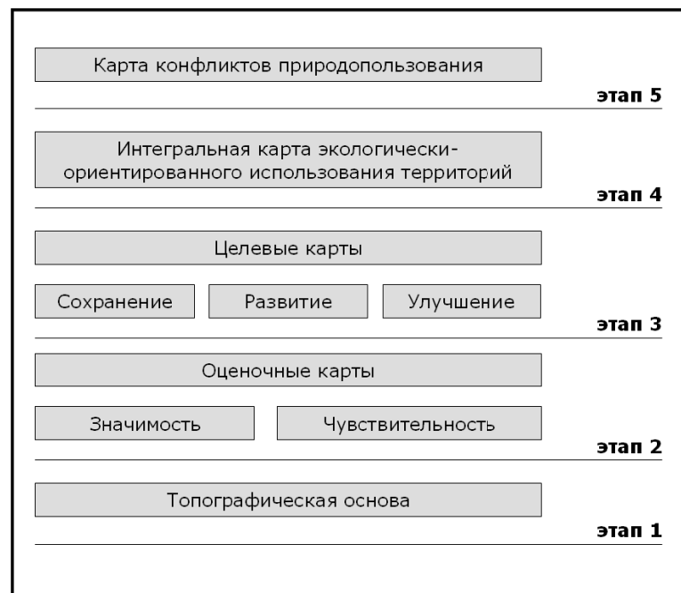
Рис. 2. Структура базы данных в ландшафтном планировании

На рисунке 2 представлена структура пространственной базы данных, наиболее полно соответствующая методике ландшафтного планирования, предложенной учеными РГУ им. И. Канта [1].